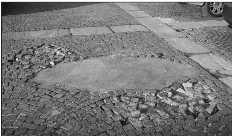
Un tentativo di coprire le buche.

Era prevedibile che quest'inverno avrebbe peggiorato la già instabile situazione della piazza Treccani di Montichiari. Erano già stati eseguiti dei lavori di "tamponamento", ma il cemento non ha retto e numerosi altri cubetti si sono divelti con il transito delle