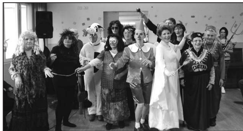
Alcuni componenti il gruppo "Insieme" alla festa di Carnevale.