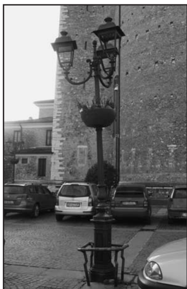
Come sono ridotti i lampioni.