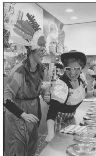
Bariste del "Mozart" vestite da carnevale.