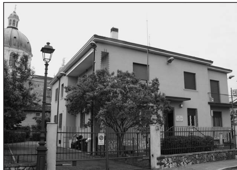
La caserma dei Carabinieri di Montichiari costruita negli anni '50. L'Amministrazione Badilini 1999, aveva approvato il nuovo progetto (Arch. De Silvestri) in via Ciotti con relativo finanziamento (2,5 miliardi). Il sindaco Rosa "bloccò" il progetto. Il sindaco Zanola da anni promette la nuova caserma che dovrebbe essere costruita con il finanziamento dei PRIVATI!